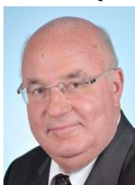
Nord Circonscription n°20