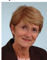
Hauts-de-Seine Circonscription n°4