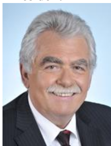
Puy-de-Dôme Circonscription n°5