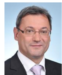
Cher Circonscription n°2

Le site web : groupe-communiste.assemblee-nationale.fr