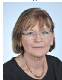
Seine-Saint-Denis Circonscription n°4