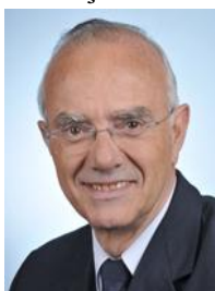
Seine-Saint-Denis Circonscription n°11