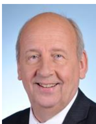
Nord Circonscription n°17