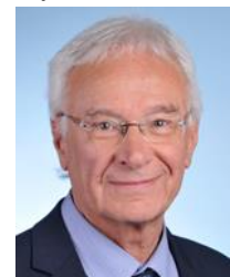
Bouches-du-Rhône Circonscription n°13