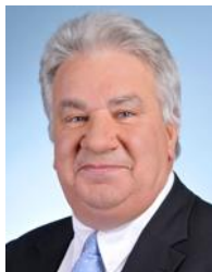
Oise Circonscription n°6