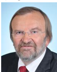
Nord Circonscription n°16