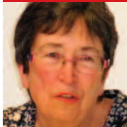
membre du CD/PCF du Finistère et de la commission nationale Santé/Protection sociale