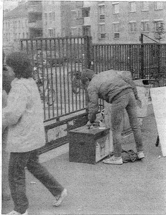
Au lycée Jules Uhry de Creil, 228 jeunes ont voté pour le boycott à 100% de l'apartheid par la France.

650 JEUNES DE L'OISE, VOTENT POUR LE BOYCOTT A 100% DE L'AFRIQUE DU SUD