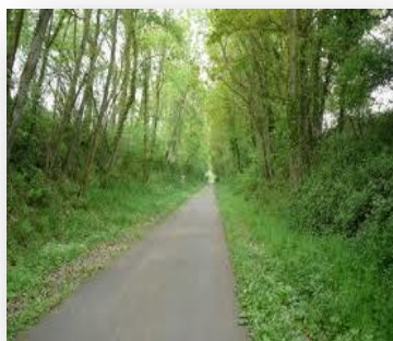
La voie verte

-19h : Pot d'accueil des copains de Dieppe. La soirée se terminera dans un petit restaurant du port de Dieppe !