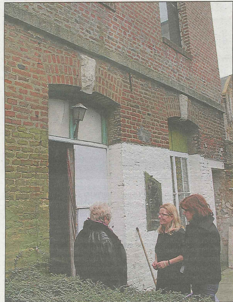
Visite d'un bien immobilier la semaine dernière à Abbeville dont le prix de vente est de 137 000 euros. Probablement surévalué, comme beaucoup d'autres biens, encore, en Picardie.

Les spécialistes annoncent une baisse des prix de l'immobilier de l'ordre de 5 à 10% en 2012. Une des conséquences de la crise, qui limite le nombre d'acheteurs potentiels.