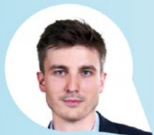
LÉON DEFFONTAINES Tête de liste PCF aux élections européennes

“ Il faut en finir avec les politiques d'austérité en Europe. Mobilisons-nous pour l'augmentation des salaires et la sortie des logiques du marché européen de l'énergie qui font exploser les prix ”