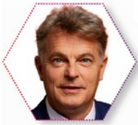
Fabien ROUSSEL Secrétaire national du PCF