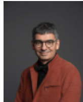
Pierre Ouzoulias Sénateur des Hauts-de-Seine p.ouzoulias@senat.fr