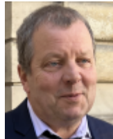
Pascal Savoldelli Sénateur du Val-de-Marne p.savoldelli@senat.fr