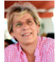
Marie-Noëlle Lienemann Sénatrice de Paris mn.lienemann@senat.fr