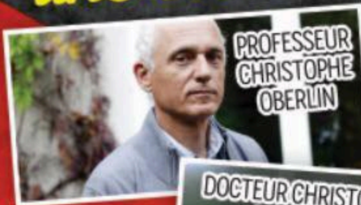
PROFESSEUR CHRISTOPHE OBERLIN