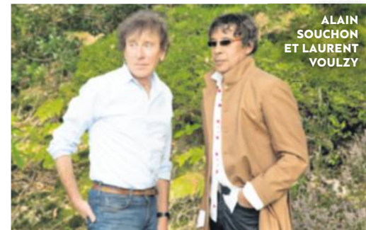
ALAIN SOUCHON ET LAURENT VOULZY