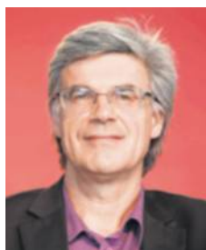
Patrick Le Hyaric Directeur de l'Humanité

Pour qu'il en soit ainsi, la campagne offensive, ambitieuse de placement du bon de soutien dans les manifestations, les rassemblements, les places et quartiers, au porte-à-porte, doit