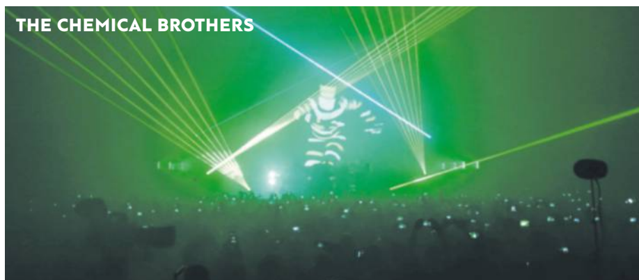
THE CHEMICAL BROTHERS