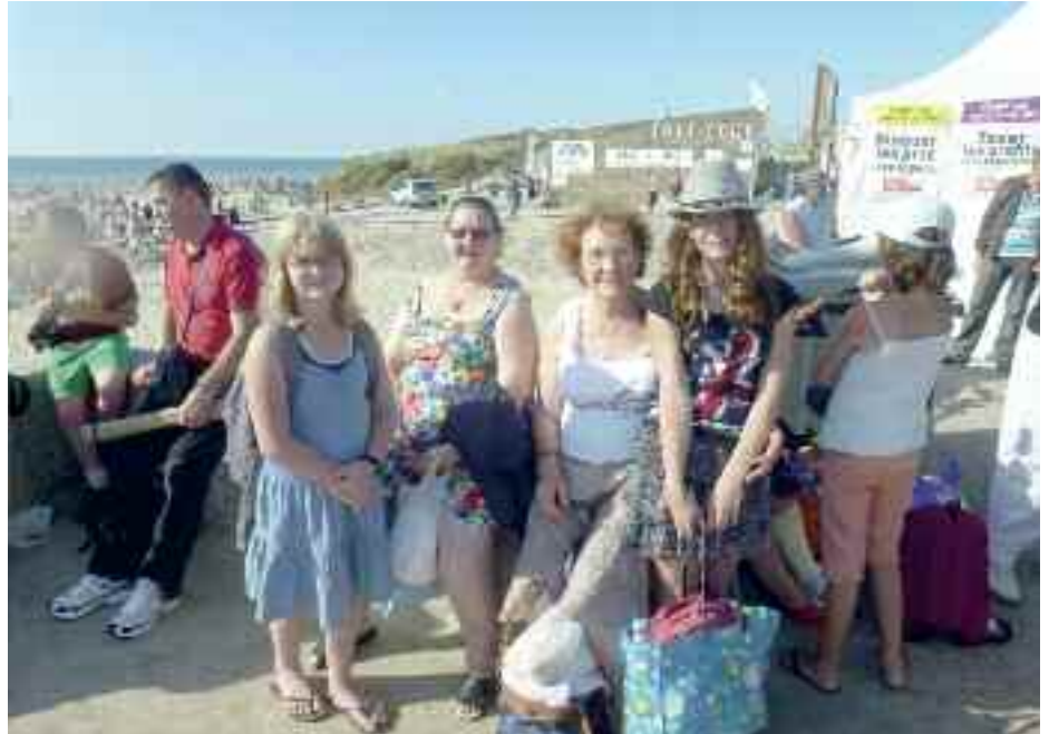
Combatifs et solidaires, les communistes de l'Oise organisent chaque année depuis 19 ans, une grande journée pour le droit aux vacances ; en 2012, 1800 personnes à Berck-Plage ! Un moment de lutte et de bonheur partagé !

soir avec ses délicieuses soupes accompagnées d'un beau morceau de pain de campagne.